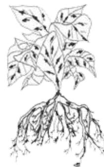
СХЕМА ЗАЩИТЫ РАПСА ОТ ВРЕДИТЕЛЕЙ

При попадании на лист Газель® быстро перемещается по поверхности листа и проникает в ткани растения, уничтожая вредителей не только при непосредственном контакте, но и скрытно живущих (системное действие).