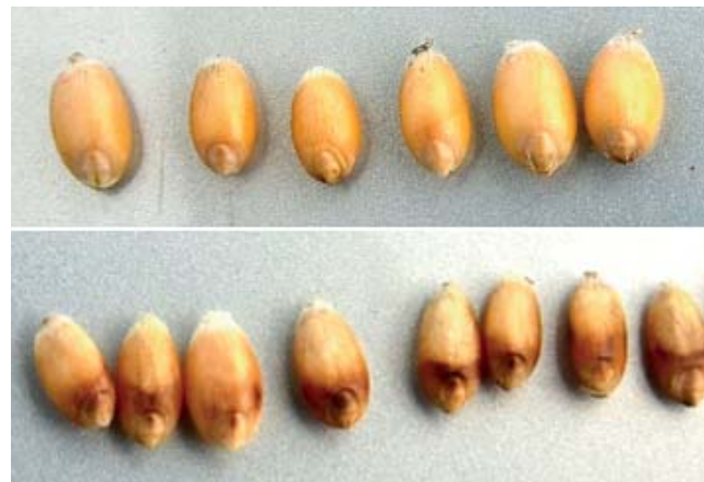
Снижение натуре и качества зерна

Во-первых, для успешной борьбы с фузариозными корневыми гнилями необходима гормональная стимуляция корневой системы проростка с целью