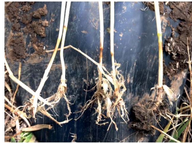
Пораженная патогеном проводящая система растений

получения мощных лигнифицированных корней, способных противостоять атакам микопатогена. Препарат БАСФОЛИАР® КЕЛП является эффективным стимулятором роста и развития корневой системы растения. В состав препарата входят микроэлементы и гормоны, необходимые для активации ростовых процессов проростка в условиях стресса (водный дефицит, температурный режим). Семена обрабатываются препаратом БАСФОЛИАР®