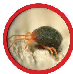
Бурый плодовый клещ Bryobia redicorzevi