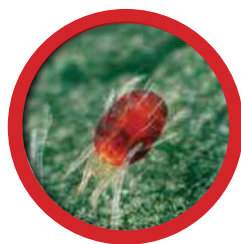
Красный плодовый клещ Panonychus ulmi