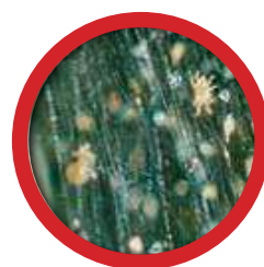
Паутинный клещ Tetranychus urticae